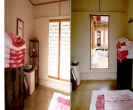
<전주 한옥생활 체험관>