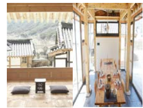
<함양 아릅지기 한옥 체험관>