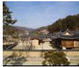
영주 선비촌 전통문화체험단지 (복합 테마파크형 단지)