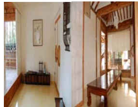
<서울 종로구 락고재>