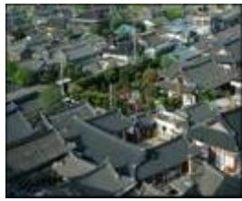
전주 전통문화체험단지 (숙박형 단지)