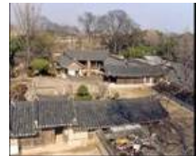
경주 교촌한옥마을 (주거형 단지)