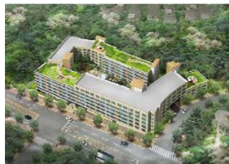
도심형실버타운(수퍼길리리, 서울 풍로구)

실버타운은 도시형, 도시근교형, 전원형으로 구분할 수 있으며 관광단지내의 형태는 전원형이라고 할 수 있다. 이는 도시형과는 달리 산, 바다와 같은 자연환경을 중시하는 형태라 할 수 있으며 비교적 저렴한 입주비로 사용이 가능하다. 하지만 실버세대를 위한 의료 및 편의시설 등이 상대적으로 도시형과 비교하여 부족하기 때문에 이러한 시설을 내부단지 내에 충족시켜주어야 하는 것이 큰 문제점중의 하나로 지적되어왔다.