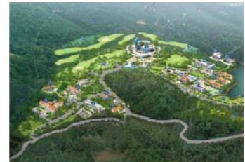
전원형(에어랜드, 송남 금산)